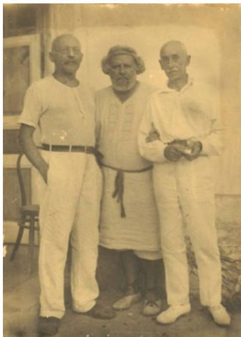
Вересаев В. В., Волошин М. А., Богаевский К. Ф.

не только толща бытия, но и душа поэта. Слова, прежде скрывавшие огонь, теперь стали неистово выбрасывать его. Да и сами слова прокалились и стали другими.